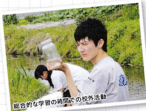
総合的な学習の時間での校外活動