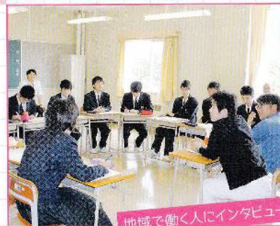
地域で働く人にインタビュー