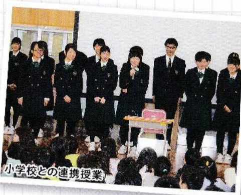
小学校との連携授業