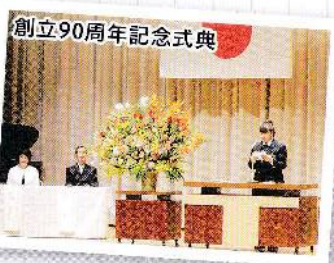
創立90周年記念式典