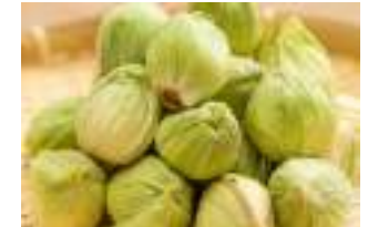
▲雪山歩きをした時に、ふきのとうがちらほら芽を出していたので、摘み取ってお家でいただきました～