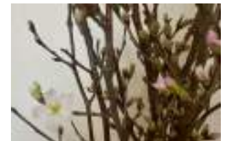
▲いただいた啓翁桜、蕾が開いていくのが綺麗すぎて惚れ惚れしちゃいます。