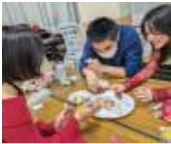
▲流行りのJKケーキ作り

2/23(金)に生涯学習センターにて、自然体験型留学で遊佐高校に留学した2名の卒業パーティーが開かれました。1期生の卒業生たち5名も駆けつけ、遊佐での思い出を振り返りながら、みんなで卒業をお祝いしました。卒業生にまつわるクイズや、在校生と卒業生によるダンスユニットの発表など盛りだくさんな内容でした。