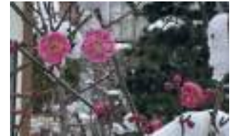
▲梅が咲いているところに雪が積もり、季節の間にいるなと実感