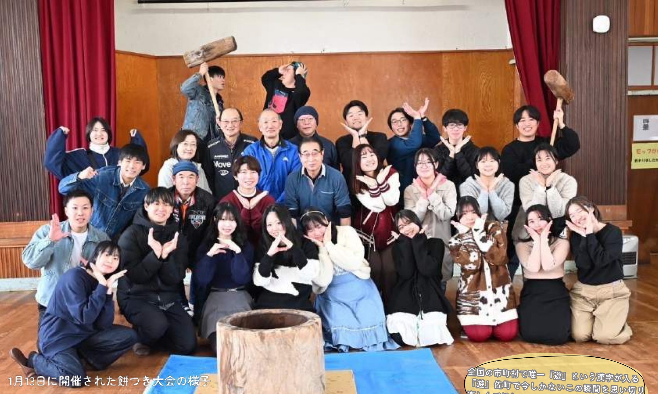
1月13日に開催された餅つき大会の様子

全国の市町村で唯一「遊」という漢字が入る「遊」佐町で今しかないこの瞬間を思い切り楽しんでほしいという想いを込めています。