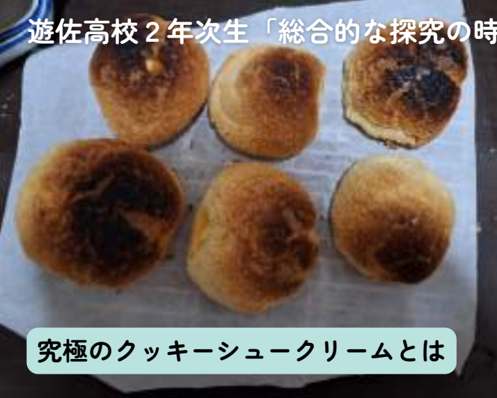
究極のクッキーシュークリームとは