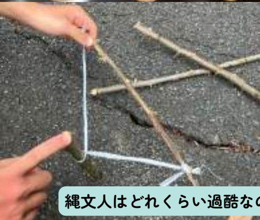
縄文人はどれくらい過酷なのか