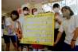
◀「パン屋小むぎ」1周年と同時に販売がスタート

2020年度、1通のお手紙（DM）がコーディネーターのもとに届いた。「遊佐高校の昼休みを楽しくしたい！」当時3年次生だった遊佐高校の生徒からプロジェクトが始まり、今年度まで遊佐高校にパンがある景色を作ってくださいました小むぎさん。デュアル実践などでも大変お世話になりました。おいしいパンを毎週ありがとうございました！！