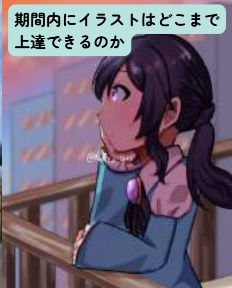
期間内にイラストはどこまで上達できるのか