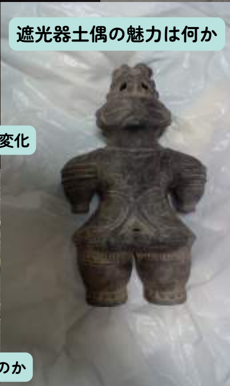
遮光器土偶の魅力は何か