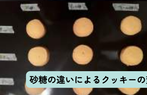
砂糖の違いによるクッキーの変化