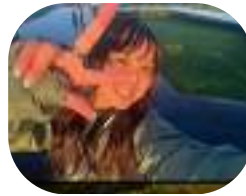
▶心結さんのインスタグラムはこちら