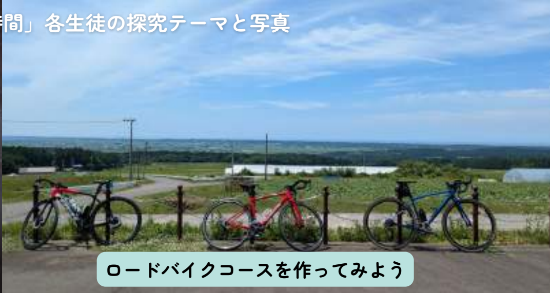
ロードバイクコースを作ってみよう