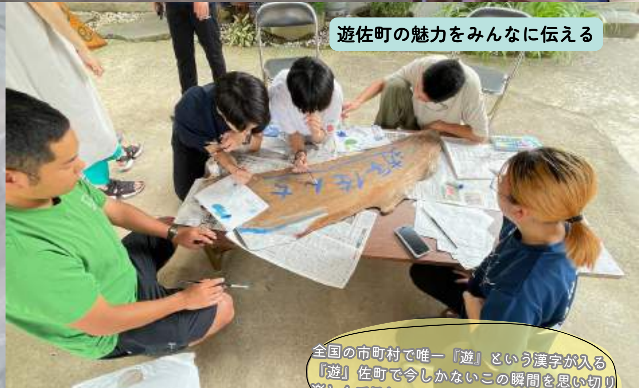
遊佐町の魅力をみんなに伝える

全国の市町村で唯一「遊」という漢字が入る「遊」佐町で今しかないこの瞬間を思い切り楽しんでほしいという想いを込めています。