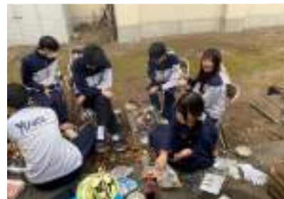
▲3年次生はみんなで協力して、買い出し、調理をしました。