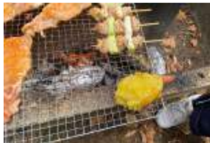
▲酒田市の「SanSanFarm」で生徒が掘ったお芋も焼きました。

11月7日の3年次「総合的な探究の時間」は、午前中に「自分のビジネスプランを考える」時間を持ち、午後は毎年恒例のみんなでごはん（今年はバーベキュー）を食べました。楽しい1日でした！