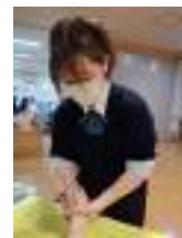
▲マッサージの様子

「デュアル実践」で本校生徒が行っていたハンドマッサージが、作成したチラシをきっかけに「社会福祉法人 幾久栄会 幸楽荘デイサービスセンター」に広がりました。「幸楽荘」からオファーを受け、利用者の方々にハンドマッサージを実施しました。デュアル実践で行った活動の輪が、地域に広がったことを感じた1日でした。