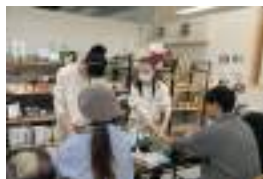
▲ハンドマッサージの様子

「産業社会と人間」の授業で、1年次生が11月5日～7日の3日間でインターンシップをしました。生徒は病院、スーパー、図書館、本屋など、遊佐町にある様々な事業所で活躍しました。「ボディケアサロンCanana」では、生徒2人が無料でハンドマッサージを実施しました。「合資会社 杉勇藤岡酒造場」では、お酒を造る作業のお手伝いをさせていただきました。協力していただいた事業所の皆様ありがとうございました！