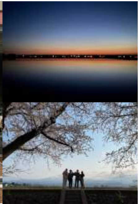
◀綺麗すぎて思わず撮影