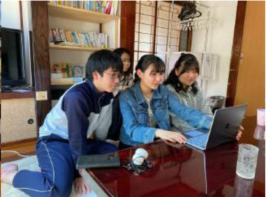
▲全国の高校が参加する「地域みらい留学」合同説明会 遊佐町・遊佐高の魅力を全国の中学生へプレゼン！