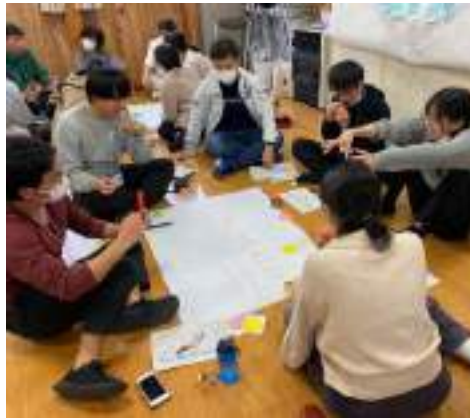
▲みんなで「私たち」の未来を考える