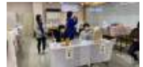
▲まるっと遊佐まつりも初参加！抽選担当でした！

地域おこし協力隊になってからの半年、新しい経験をたくさんしました。初めての場所に行く、初めましての人に出会う、そこから繋がりが生まれる。そうやって自分の世界は広がるんだと改めて実感しました。