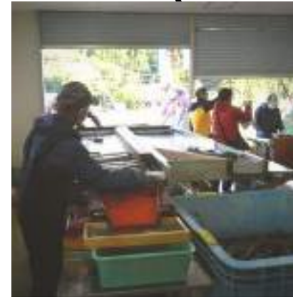
▲インターン中に見学に行った 鮭の孵化場