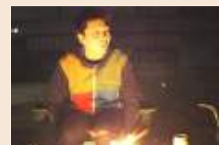
▲「光っている状態になる」感じ？

エンライトメント (Enlightment) とは何か “啓発” と日本語訳される言葉との出会いが昨年ありました。これって何だろう？