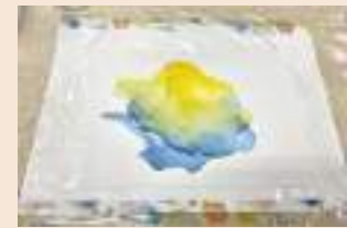
▲芸工大でやったアルコールインクアートが楽しかった！

自分の感性を守るためにしたいことは何か。気付いたら日々が過ぎ去っていく中で、自分のときめきやワクワクを守るには何を？