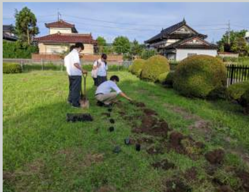
↑ 遊佐みらい同好会（ひまわり植えてます。） 自分たちの「やってみたい！」を形にしていける部活です！

萌衣 私も、同じ同好会に所属しています。今はひまわりのプロジェクトやりたいと思っています！遊佐高校がひまわりだらけになったら素敵だなって思って、地域の人と一緒に活動できたらなとも思っています！！