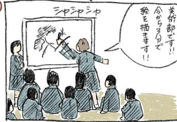
4 改めて新入生ようこそ!!