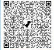
遊佐高校ホームページ