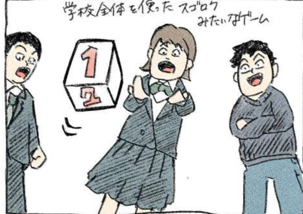
学校全体を使ったスゴロクみたいゲーム