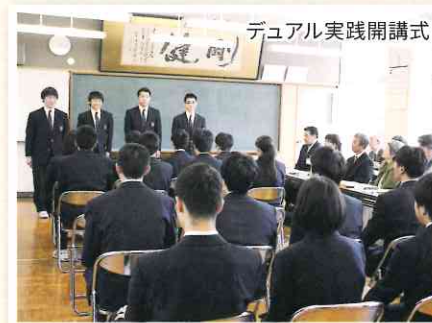
デュアル実践開講式