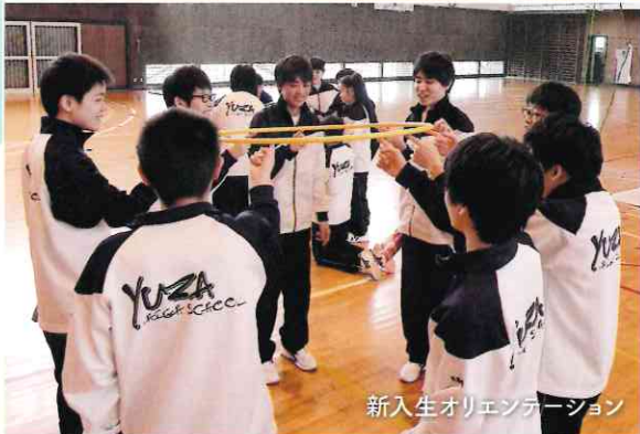
新入生オリエンテーション